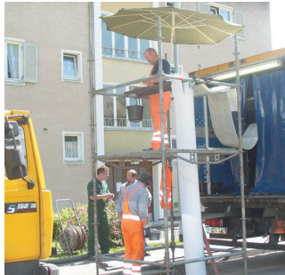
Sanierung in der Wiedemannstraße