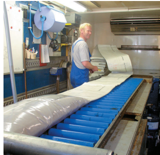
Füllen des Schlauches mit einem aushärtbarem Harzgemisch.