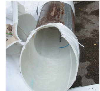
Fertiges „Rohr im Rohr“.

Durch den Einsatz optischer Überwachungssysteme werden Schäden an der Kanalisation frühzeitig festgestellt und behoben. Dadurch leisten die Stadtentwässerungswerke einen wichtigen Beitrag zum Umweltschutz in Lindau und ermöglichen gleichzeitig einen wirtschaftlichen Betrieb des Kanalnetzes (s. BZ vom 7.10.05).