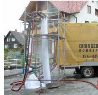
Einbau im Bräuweg.